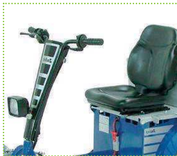
Dettaglio manubrio e sedile ergonomico