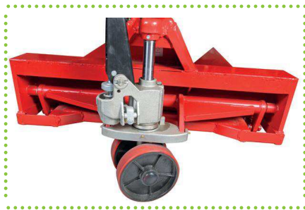
Dettaglio pompa zincata