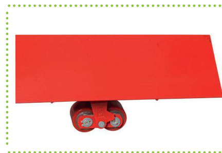
Dettaglio forca a tegolo e rullo doppio