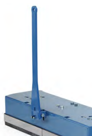
Dettagli agganci per il traino

Timone autobloccante in acciaio su lato ruote fisse. Aggancio a piede facile e comodo. Occhiello Ø 26.5 mm. Il timone tende a risalire in posizione verticale grazie alla molla a gas.